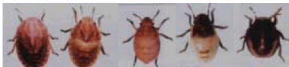
پوره سن ۱ پوره سن ۲ پوره سن ۳ پوره سن ۴ پوره سن ۵

پوره سن غلات با تغذیه از گندم (در مرحله شیری و شیری خمیری) خاصیت ناوایی نان را از بین می برد خسارت در این مرحله کیفی است. دانه های سن زده معمولاً کوچکتر و چروکیده اند و همچنین یک لکه تیره رنگ در حاشیه دانه وجود دارد.