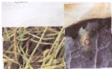
شکل ۱۲- لکه سیاه آلترناریایی در برگ و غلاف