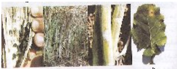
شکل ۱۱- چرخه زندگی بیماری پوسیدگی اسکروتینیایی