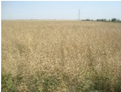
شکل ۲۴- مزرعه آماده برداشت کلزا (سیستان و بلوچستان)