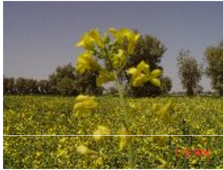
شکل ۷/۱- مرحله گلدهی کلزا (سیستان و بلوچستان)

رسیدگی و بلوغ: رسیدگی زمانی آغاز می شود که آخرین گلها روی ساقه اصلی تشکیل می شوند. در این مرحله ساقه و جداره غلاف مهمترین منبع تأمین کننده مواد غذایی برای رشد دانه می باشند. پر شدن بذر و پس از آن رسیدگی با تغییر رنگ گیاه نمود پیدا می کند. ساقه و غلاف متمایل به زرد می شود و به تدریج خشک و شکننده می شود. همزمان با رسیدگی پوسته سبز به قهوه ای تبدیل می شود و رطوبت بذر به سرعت از دست می رود. وقتی دانه های همه غلافها تغییر رنگ یافت بوته ها از بین می رود. در هنگام برداشت رطوبت بذر باید حدود ۱۰ درصد باشد.