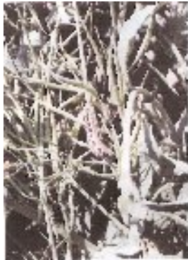
شکل ۱۶- لارو پروانه سفیدکلم