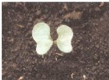
شکل ۳- جوانه زنی و ظهور برگهای لپه ای کلزا

قبل از سبز شدن (جوانه زنی): در این مرحله بذر رطوبت جذب نموده متورم و پوشش دانه جدا می شود. ریشه به طرف پایین رشد کرده و منجر به رشد گیاهچه می شود هیپوکوتیل به طرف بالا رشد کرده و لپه ها را به طرف بیرون خاک می برد.