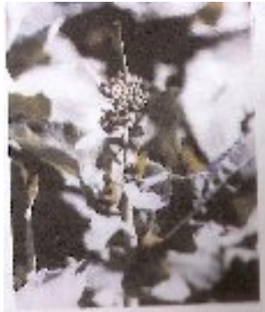
شکل ۶- مرحله ساقه دهی و غنچه دهی کلزا

ساقه دهی و غنچه دهی: تشکیل غنچه ها با افزایش دما و طول روز آغاز می شود. برگهای متصل به ساقه اصلی باز می شوند و خوشه غنچه های گل با بلند تر شدن ساقه اصلی بزرگ می شوند.