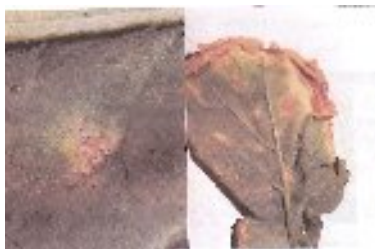
شکل ۱۳- بیماری سفیدک دروغی در برگ کلزا