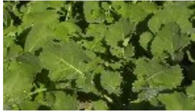
شکل ۱/۵- مرحله روزت کلزا (سیستان و بلوچستان)

ساقه دهی و غنچه دهی: تشکیل غنچه ها با افزایش دما و طول روز آغاز می شود. برگهای متصل به ساقه اصلی باز می شوند و خوشه غنچه های گل با بلند تر شدن ساقه اصلی بزرگ می شوند.