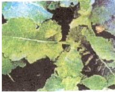
شکل ۲۱- کمبود گوگرد در کلزا