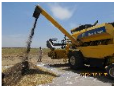
شکل ۲۸- عملیات پس از برداشت کلزا (قبل از هوادهی) (سیستان و بلوچستان)

و همچنین فساد پذیر بودن محصول کلزا به دلیل درصد بالای روغن عملیات پس از برداشت کلزا دارای اهمیت فراوانی می باشد. اولین فرایند پس از برداشت کلزا خشک کردن دانه جهت نگهداری و فرآیند می باشد. که به طور معمول دانه تا رطوبت ۷-۸ درصد خشک می شود زیرا در غیر این صورت به دلیل فعالیت تنفسی بالای کلزا بعد از برداشت و گرمای ناشی از تنفس رشد و فعالیت کپک ها و کلوخه شدن دانه ها به همراه تولید انواع سم های قارچی (مایکوتوکسین ها) سبب افزایش اسیدهای چرب آزاد و اسیدیته خواهد شد. از آنجایی که شرایط خشک کردن دانه کلزا تأثیر زیادی بر روی کیفیت روغن دارد لذا هوا دهی و خشک کردن محصول کلزا پس از برداشت بسیار مهم می باشد.