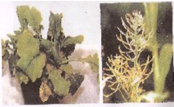
شکل ۲۲- کمبود بر در کلزا