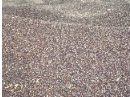
شکل ۲۶- دانه های برداشت شده کلزا (سیستان و بلوچستان)