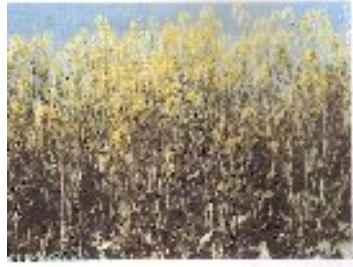
شکل ۷- مرحله گلدهی کلزا