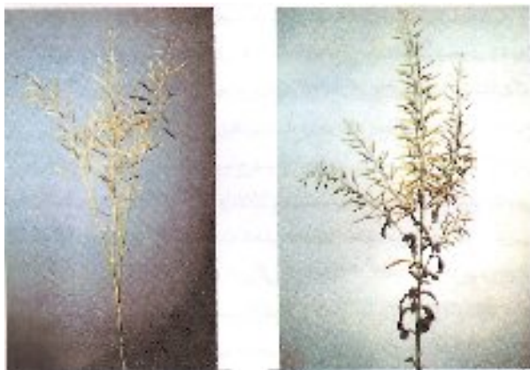
شکل ۸- مرحله رسیدگی فیزیولوژیک شکل ۹- مرحله رسیدگی کامل