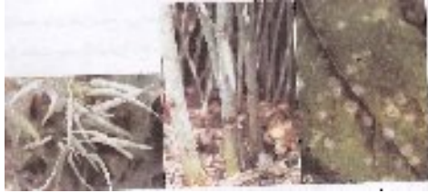
شکل ۱۴- بیماری سفیدک پودی