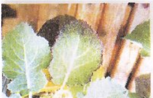
شکل ۱۹- کمبود فسفر در کلزا