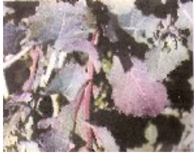
شکل ۱۸- کمبود ازت در کلزا