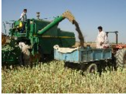
شکل ۲۵- مزرعه برداشت شده کلزا (سیستان و بلوچستان)