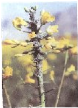
شکل ۱۷- تجمع شته مومی کلزا

۵-۹- تغذیه: عکس العمل کلزا به کودها شبیه محصولات غلات دانه ریز بوده و بستگی به حاصلخیزی خاک دارد. ازت و گوگرد کلید موفقیت برای رسیدن به عملکرد بالا می باشد. مواد نیتروژن دار و پتاسی نمی تواند بصورت مستقیم با بذر تماس پیدا کنند و بایستی بصورت نواری حداقل به فاصله ۵ سانتیمتر دورتر از بذر ریخته شود آزمایش خاک برای تعیین صحیح مقدار مواد غذایی مورد نیاز گیاه باید انجام شود. کلزا تمایل زیادی به مصرف گوگرد دارد. ۲۲۵۰ کیلوگرم حاصل از هر هکتار کلزا دارای ۱۳/۵ کیلوگرم گوگرد در ساقه و برگ و حدود ۱۷ کیلوگرم گوگرد در بذر می باشد در صورتیکه همین مقدار در گندم فقط دارای ۵/۶ کیلوگرم گوگرد در بذر و ۸ کیلوگرم در ساقه و برگ دارد در نتیجه مقدار گوگرد در خاک در تولید کلزا نقش بسزایی دارد حتی کمبود گوگرد در خاک عدم وجود کلزا در مزرعه را رقم می زند. یک نمونه آزمایش برای تعیین مقدار گوگرد در خاک نمی تواند نمایانگر درصد گوگرد در خاک باشد پس بایستی در مقاطع مختلف زمانی و از قسمتهای مختلف مزرعه نمونه برداری شود.