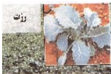
شکل ۵- مرحله روزت کلزا

شکل ۴- گياهچه دو برگي کلزا شکل ۴/۱- گياهچه کلزا (سيستان و بلوچستان) روزت : اولين برگ حقيقي ۴-۸ روز پس از سبز شدن تشكيل مي شود برگهای مسن تر و بزرگتر در پايين و برگهای کوچکتر در مرکز ايجاد مي شوند. ريشه ها توسعه پيدا مي کنند. طول ساقه تغيير نمی کند اما قطر آن افزايش مي يابد.