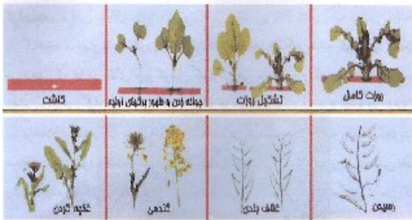
شکل ۲- مراحل مختلف رشد و نمو کلزا

قبل از سبز شدن (جوانه زنی): در این مرحله بذر رطوبت جذب نموده متورم و پوشش دانه جدا می شود. ریشه به طرف پایین رشد کرده و منجر به رشد گیاهچه می شود هیپوکوتیل به طرف بالا رشد کرده و لپه ها را به طرف بیرون خاک می برد.