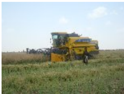
شکل ۲۷- برداشت مکانیزه کلزا توسط کمباین (سیستان و بلوچستان)

۲- برداشت مستقیم: به برداشت کلزا توسط کمباین برداشت مستقیم گویند. در این نوع برداشت بوته های کلزا بایستی به طور کامل رسیده باشند. در این حالت میوه ها خشک بوده و دانه ها به رنگ سیاه خواهند بود. بایستی میزان رطوبت در مرحله مزبور ۱۰ تا ۱۲ درصد باشد. ارقام هیبرید کلزا به دلیل رسیدگی یکنواخت و زودرس برای برداشت مستقیم مناسب می باشند. وجود ۸۵ تا ۹۰ درصد بذور سیاه در غلاف ها ویژگی کاربردی جهت شناسایی بهترین زمان برداشت می باشند. در برداشت مستقیم دقت در تعیین زمان مناسب برداشت، تنظیم دقیق کمباین و استفاده از هد مخصوص کلزا بسیار مهم است.