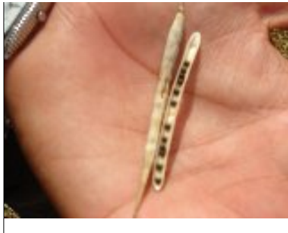
شکل ۲۳- دانه های رسیده داخل غلاف (سیستان و بلوچستان)

است که همه دانه ها سیاه شده و رطوبت دانه به کمتر از ۱۵٪ رسیده باشد. اما بمنظور جلوگیری از برخورد با شرایط نامساعد و ریزش های ناشی از رسیدگی زیاد توصیه می شود، کشاورزان منتظر نمانند که بوته ها بصورت کامل رسیده و خشک شوند و برداشت کلزا را در مرحله ۵۰ درصد تغییر رنگ بذور داخل خورجین های ساقه اصلی و خورجین های شاخه های درجه یک شروع نمایند بنابراین در تصمیم گیریهای زراعی در رابطه با انتخاب رقم، تاریخ کاشت، میزان بذر، کود، آبیاری و... بهتر است زمان برداشت نیز در نظر گرفته شود.